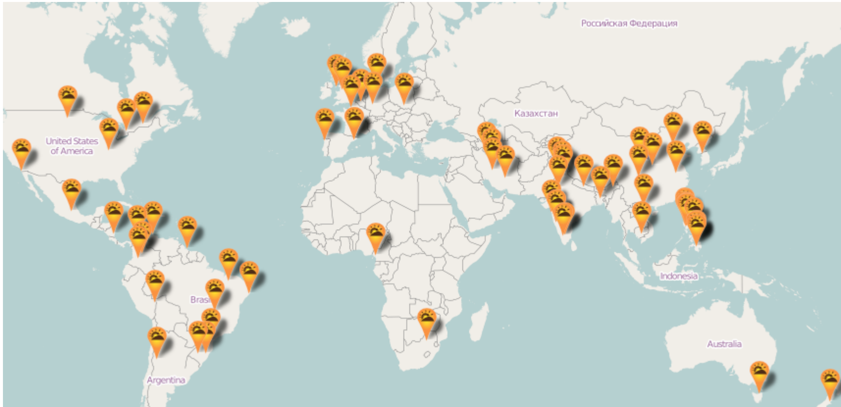
Mapa de Eventos SFD 2015 registrados a 17 de Agosto